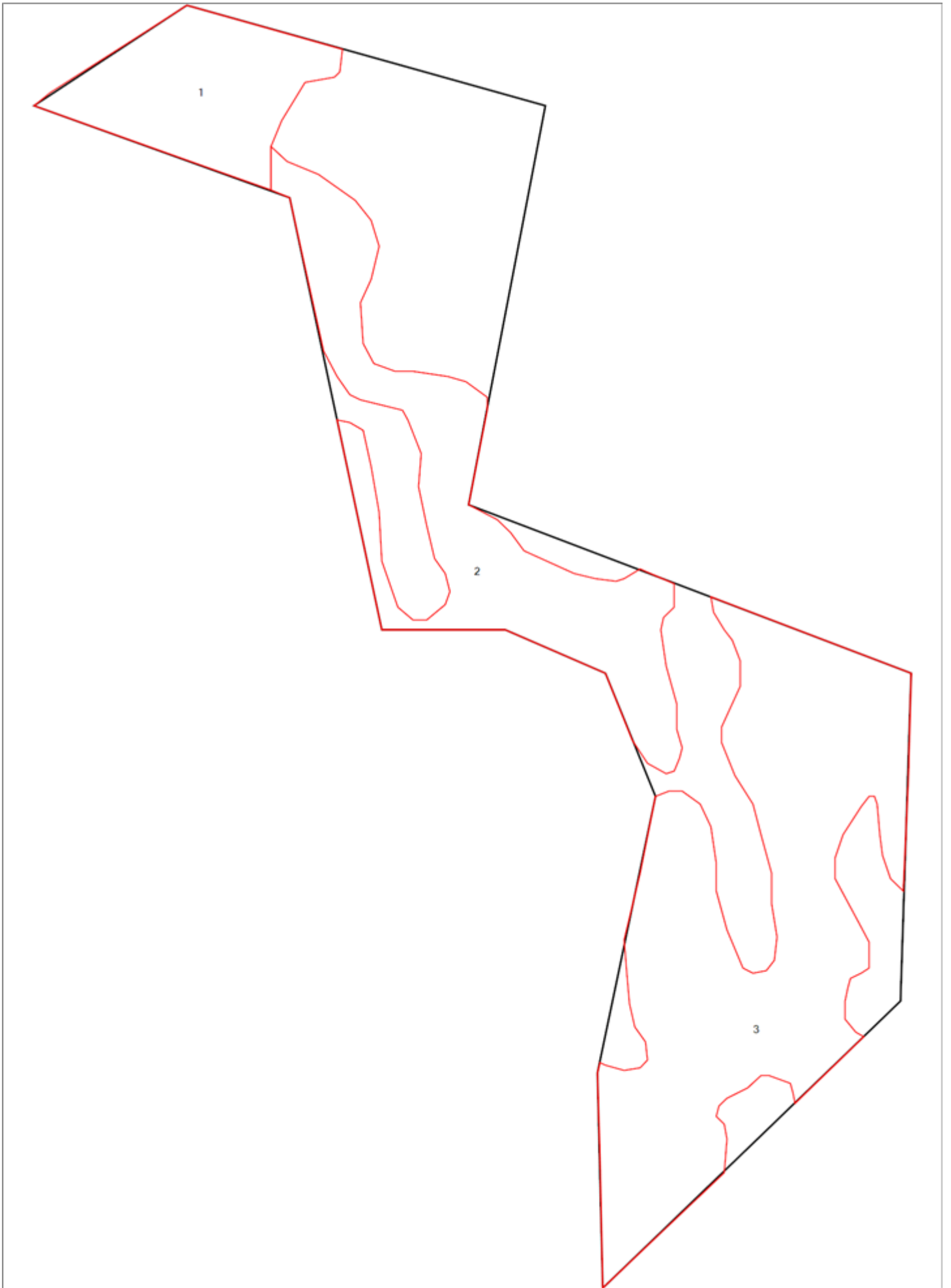
Zemes vienība: 36440010132 Mērogs: 1:1694