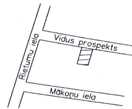
ZEMES IZVIETOJUMA SHĒMA

Robežpunktu koordinātas LKS92 TM koordinātu sistēma